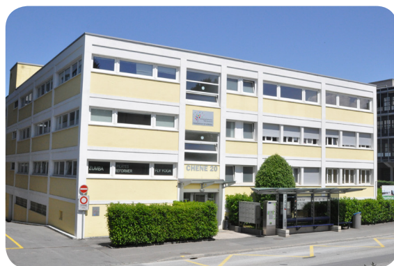
Site de Renens